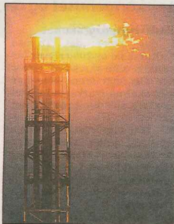
MINDRE UTSLIPP? LNG-fabrikken på Melkøya.